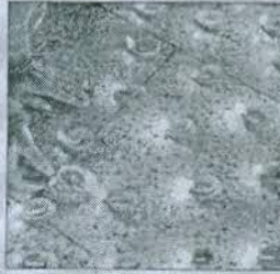
સૌથી વધુ ખર્ચ કરી બજારમાં

એસોચેમના સોશિયલ ડેવલપમેન્ટ ફાઉન્ડેશન દ્વારા એક સર્વે હાથ પરવામાં આવ્યો હતો. જેમાં એવા તારણો રજૂ કરવામાં આવ્યા હતા કે, 'લોકોનો વિશ્વાસ ગત વર્ષ કરતા ઓછો થતાં તેની અસર